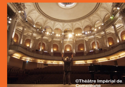
// Théâtre Impérial de Compiègne

Soutenu par un cercle de mécènes créé en octobre 2010.