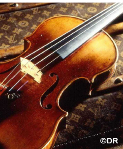
// Stradivarius collection du groupe LVMH / Moët Hennessy - Louis Vuitton

Concrètement, qu'est-ce que le MÉCÉNAT CULTUREL ?